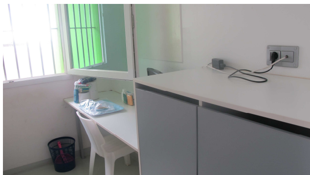
Cellule du Centre pénitentiaire de Saint-Denis

• Le défi de la sécurité publique et civile : les phénomènes de violence sont moins marqués qu'en métropole : alors que La Réunion est au 24 ème rang en termes de population au niveau national, les faits d'insécurité la placent comme un département relativement sûr. Toutefois, on constate un fort sentiment d'insécurité lié notamment à la médiatisation des actes de délinquance qui alimente la crainte d'une contagion de la violence. En outre, on constate une forte augmentation de la délinquance des mineurs, qui représentent un mis en cause sur cinq, notamment pour des faits très graves. Le centre pénitentiaire de Saint-Denis représente un modèle d'humanisation et de modernisation, caractérisé par l'absence de surpopulation carcérale et une politique active de prévention du suicide.